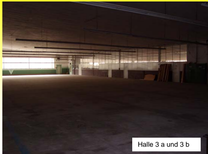
Halle 3 a und 3 b