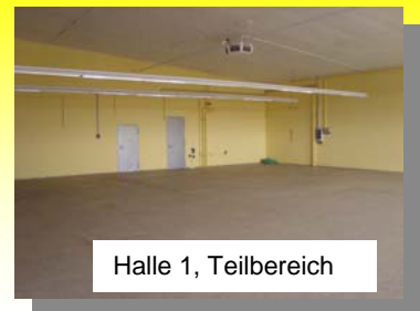
Halle 1, Teilbereich